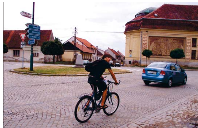
Jedno z nejušnějších míst v Telči si kruhový objezd zaslouží.

ná a nepřehledná. Právě v těchto dnech kraj začal s její opravou a přeměnou na kruhový objezd. Stavbu využilo město také k tomu, aby zde opravilo vodovod a kanalizaci. „Ulice Slavičkov a Masarykova nakonec dostanou půl kilometru a ulice Staňkova čtvrt kilometru nového povrchu. Stavba přijde na více než dvaapadesát milionů korun,“ popsal dílo náměstek hejtmana pro dopravu Petr Pospíchal (ČSSD).