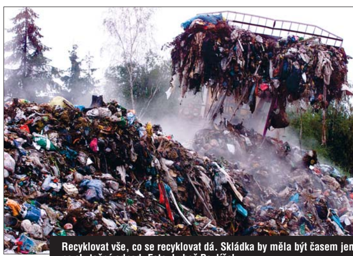
Recyklovat vše, co se recyklovat dá. Skládka by měla být časem jen na skutečný odpad.

První zlepšení bychom měli na vlastní kůži pocítit do dvou let a všechna opatření, která plán předpokládá, by měla být dokončena za deset let. „Když spočítáme, kolik bude doplnění technické vybavenosti stát, dostaneme se na částku kolem 650 milionů korun. Na druhou stranu je třeba říci, že zároveň v oblasti zpracování odpadu vznikne asi 300 nových pracovních míst,“ prohlásil Ivo Rohovský.